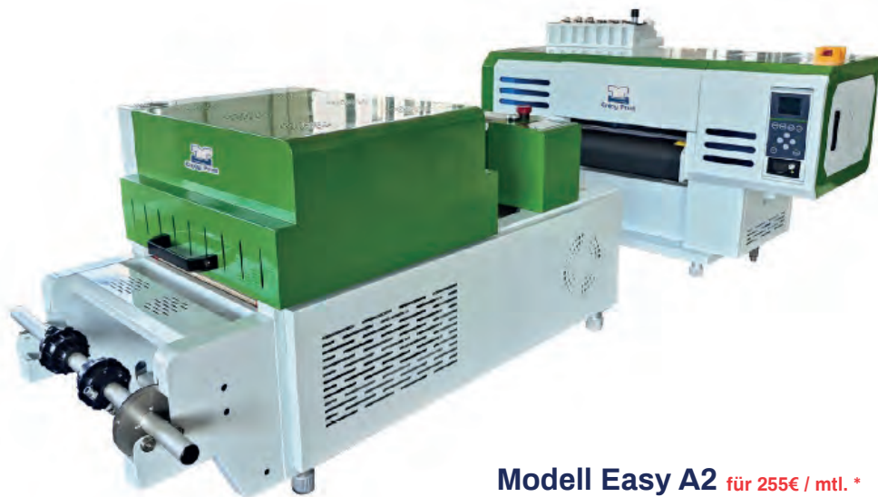
Modell Easy A2 für 255€ / mtl. *