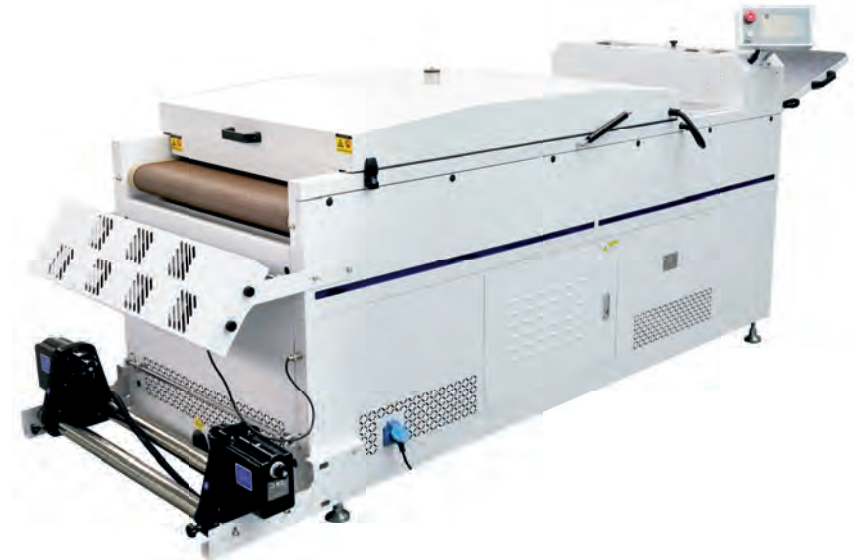
DF-800 L Optimal für T64