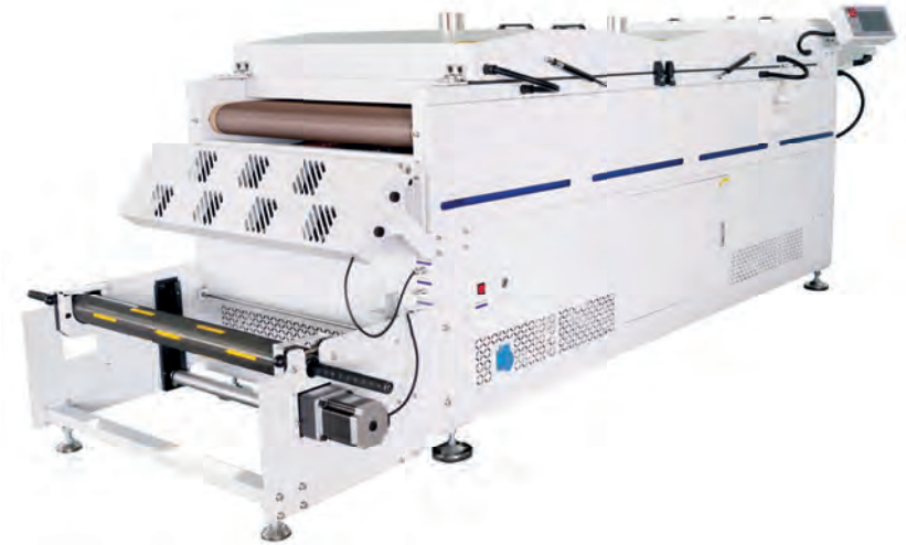
DF-1200 Pro Ofen für DTF-Drucker mit 120CM Druckbreite