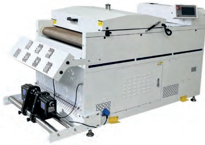
DF-800 A Optimal für T62/T63